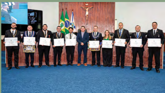
Sessão Solene em homenagem ao Dia Municipal do DeMolay