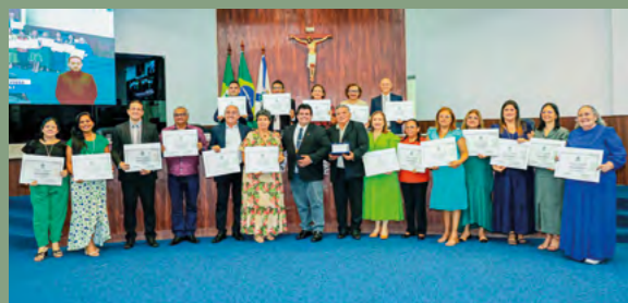
Solenidade de homenagem à Comunidade Corpo Místico de Cristo