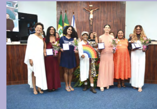
Adriana Nossa Cara

Em solenidade realizada no dia 8 de março, o Legislativo Municipal homenageou 39 mulheres escolhidas pelas vereadoras da Casa. O momento celebrou o papel da mulher na sociedade e a trajetória das homenageadas.