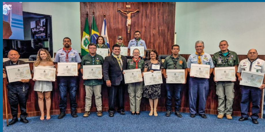
Solenidade celebra o Dia do Escoteiro e do Escotismo