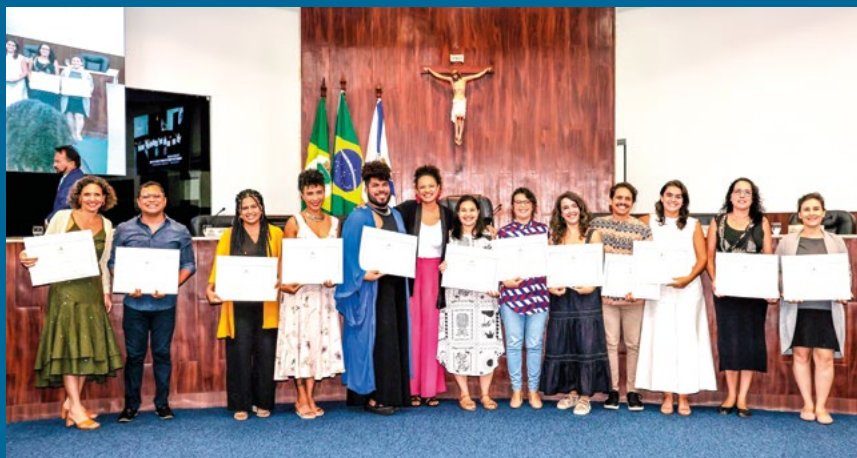
Sessão Solene celebra a profissão de Arquitetura e Urbanismo