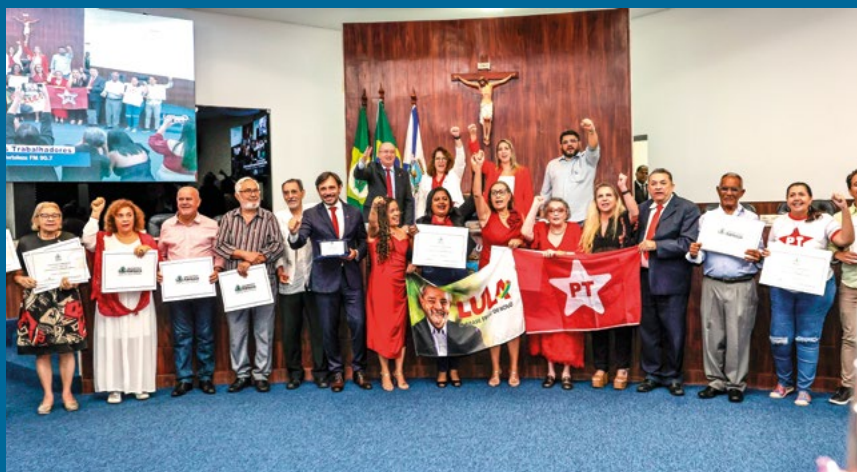
Homenagem do Legislativo celebra os 44 anos do Partido dos Trabalhadores (PT)