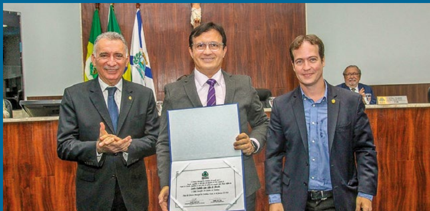
Outorga do Título de Cidadão de Fortaleza ao Reitor da UFC, Custódio Almeida