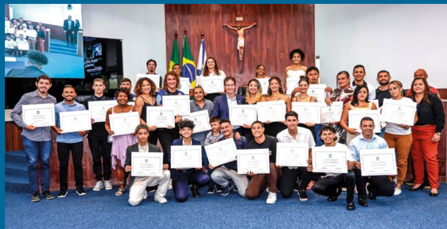
Solenidade celebra os 10 anos da Rede Cuca