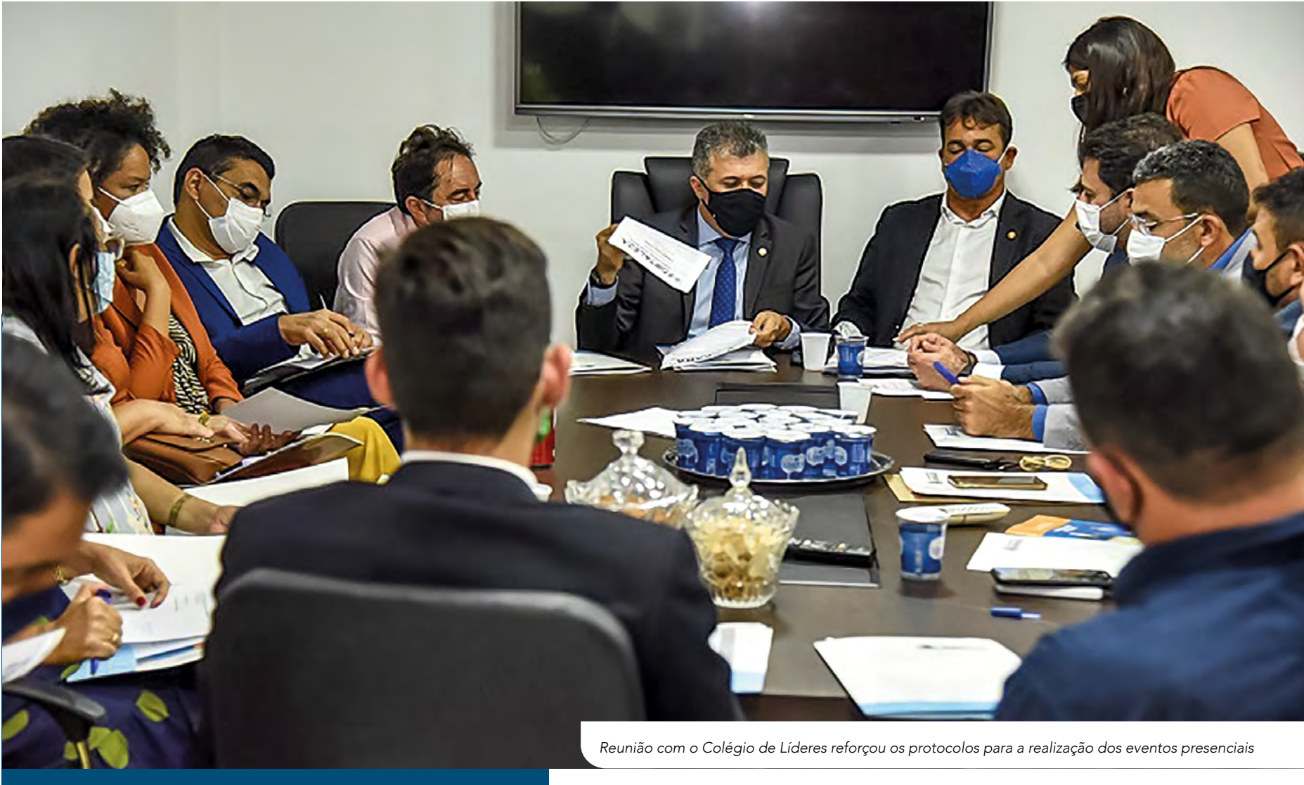
Reunião com o Colégio de Líderes reforçou os protocolos para a realização dos eventos presenciais

Para a realização das audiências ou solenidades, os vereadores deverão solicitar a marcação com 15 dias de antecedência da data escolhida para o evento