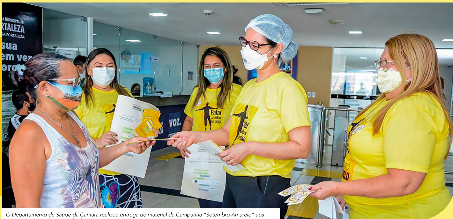
O Departamento de Saúde da Câmara realizou entrega de material da Campanha "Setembro Amarelo" aos vereadores, servidores e visitantes

Na Campanha, o Legislativo fala do poder da conversa com uma pessoa com tendências suicidas, trocar frases como "Vai dar tudo certo" ou "Não fala besteira" por "Me fale mais sobre isso", "Faz tempo que se sente assim?" e "Vamos procurar ajuda profissional? Eu posso te acompanhar". O cuidar da saúde mental é abordado destacando a necessidade de manter o equilíbrio entre corpo, alma e mente para se obter o bem-estar e garantir a saúde.