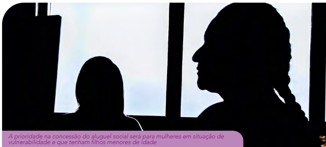
A prioridade na concessão do aluguel social será para mulheres em situação de vulnerabilidade e que tenham filhos menores de idade

As mulheres de Fortaleza vítimas de violência doméstica e familiar, que estejam em situação de risco e impedidas de retornar ao lar, poderão recorrer ao benefício 'Aluguel Social Maria da Penha'. A medida concede o valor de R$ 420 mensais por um período de 12 meses e ajuda as mulheres a saírem do estado de dependência e romperem o ciclo de agressão em que estão inseridas.