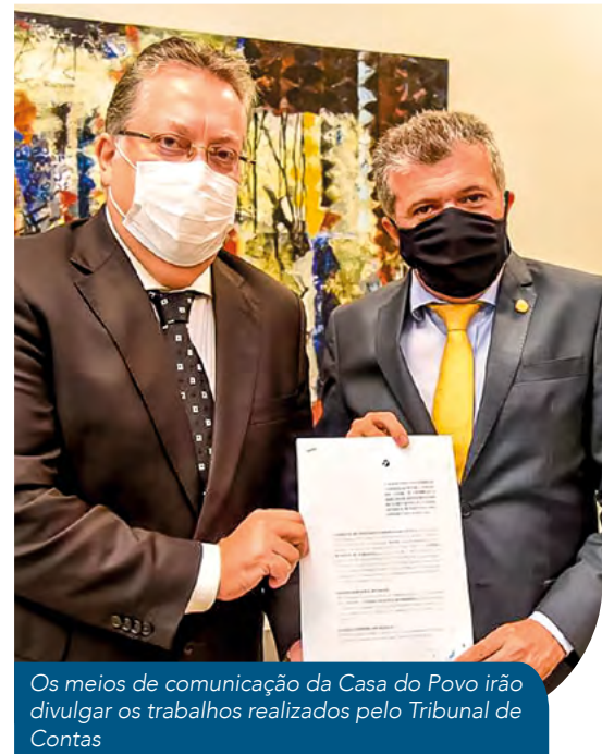
Os meios de comunicação da Casa do Povo irão divulgar os trabalhos realizados pelo Tribunal de Contas

O Programa Acontece TV será transmitido pela TV Fortaleza, canal aberto digital 7.2, e os podcasts serão divulgados na Rádio Fortaleza (FM 90,7).