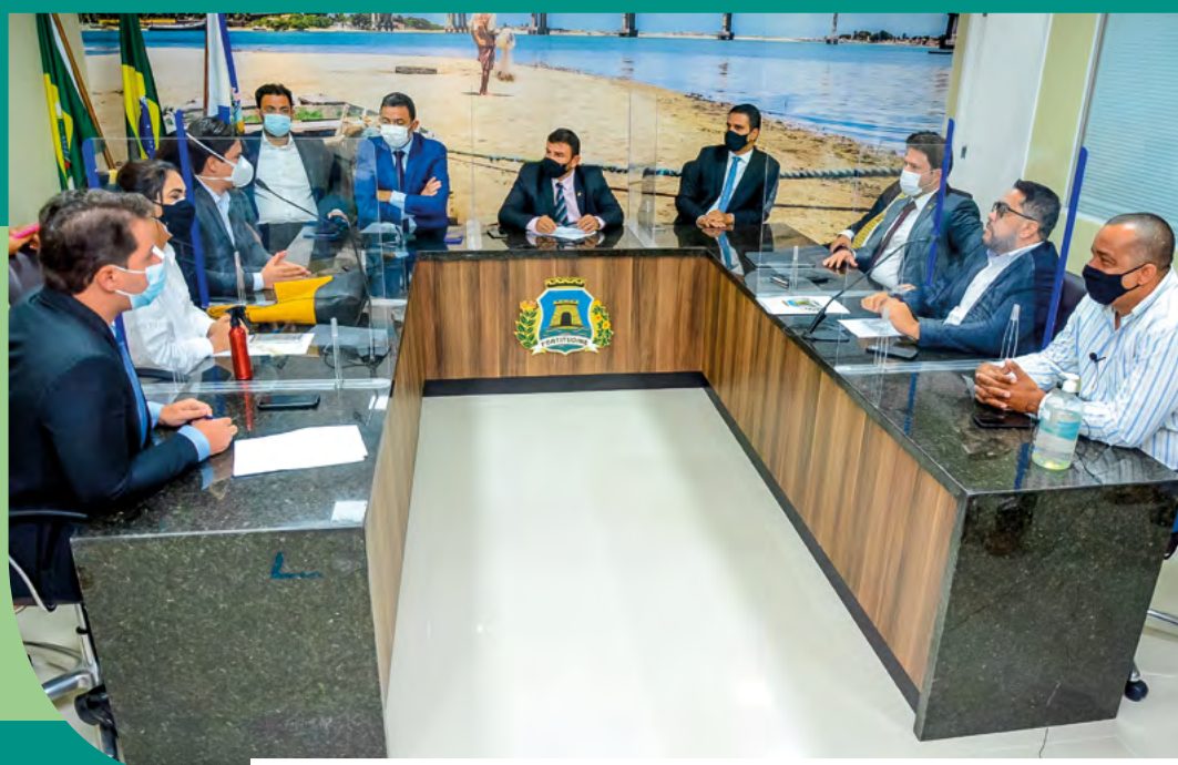
Parlamentares receberam representantes de motociclistas para mediar a construção de uma proposta junto ao Executivo

Durante o mês de setembro, a Câmara Municipal de Fortaleza formou uma comissão especial para dialogar com motociclistas do serviço de transporte de passageiros por aplicativo, que reivindicam a regulamentação da atividade no Município. Os parlamentares receberam a categoria nos dias 8 e 15 de setembro, buscando a mediação junto ao Executivo para as pautas apresentadas.