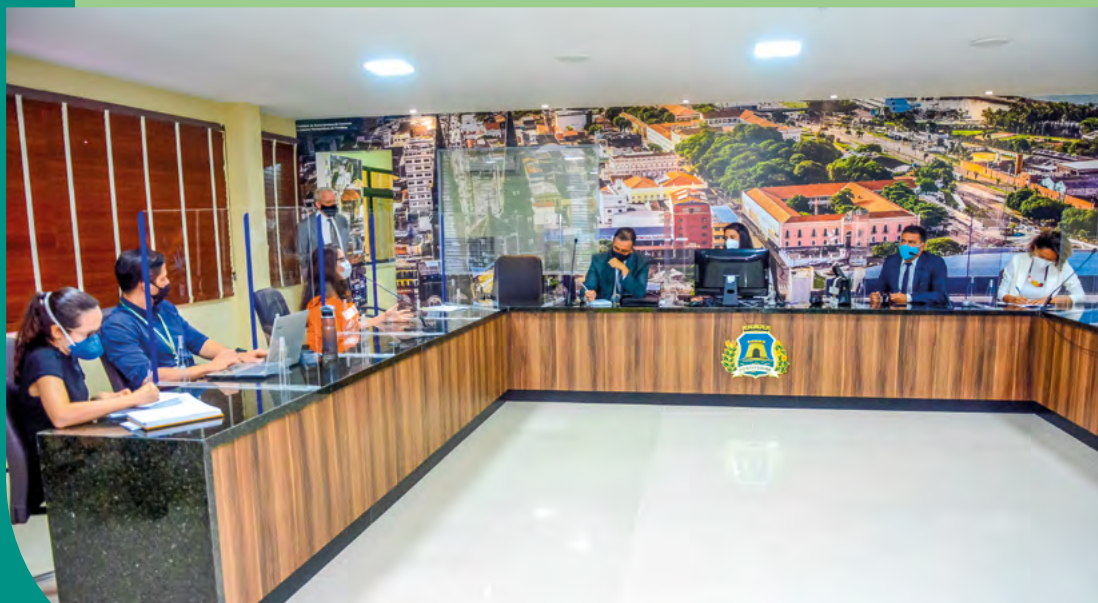
Os Fisioterapeutas e Terapeutas Ocupacionais foram aprovados para as vagas do Cadastro de Reserva

A Comissão de Saúde e Seguridade Social da Câmara recebeu profissionais que fazem parte do Conselho Regional de Fisioterapia e Terapia Ocupacional da 6ª Região (Crefito-6), para tratar sobre a convocação do cadastro de reserva dos concursos realizados nos anos de 2016 e 2020.