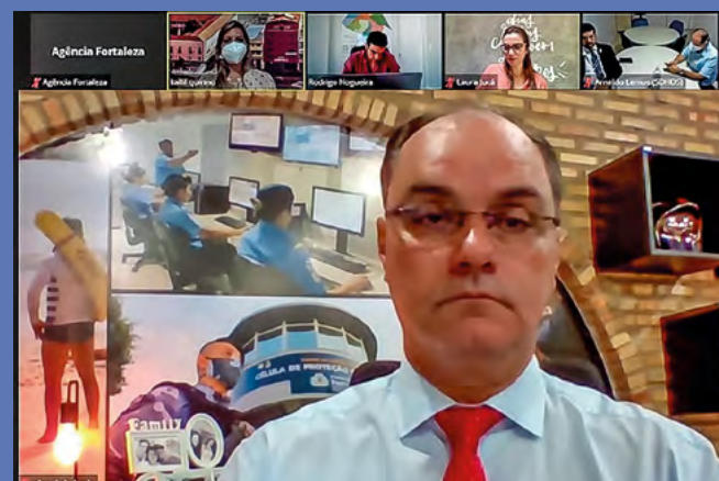
Secretários apresentaram ações realizadas pelo Executivo